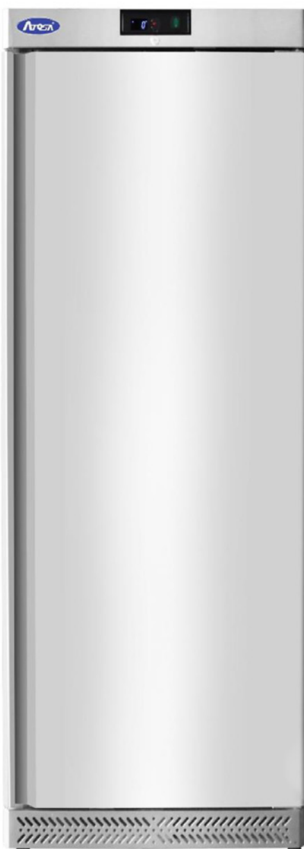
ARMOIRE INOX 380 L