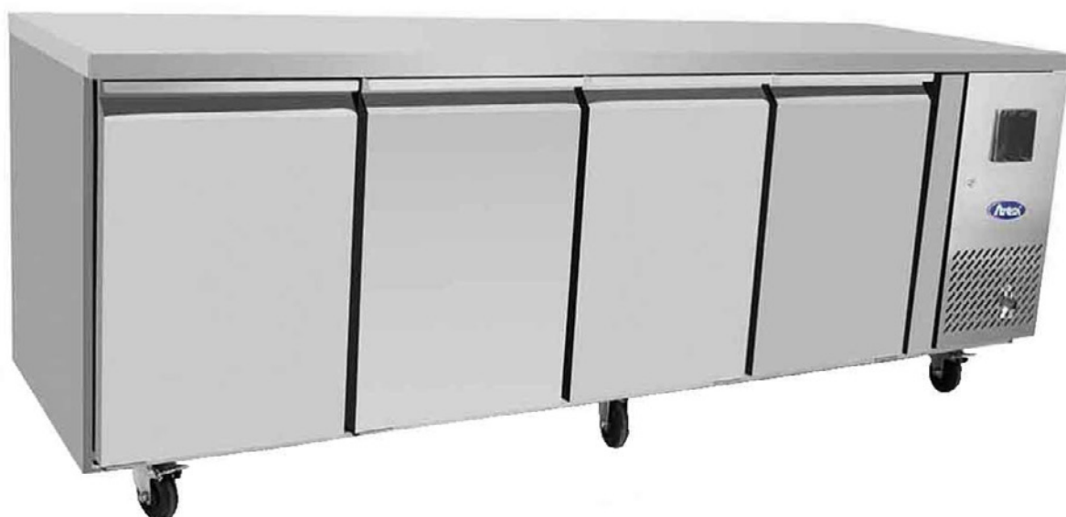
TABLE DE PRÉPARATION NÉGATIVE